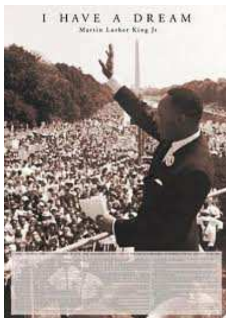
Εικόνα 3: Εκφώνηση λόγου στην μεγάλη συγκέντρωση στην Ουάσιγκτον.

Ο Μάρτιν Λούθερ Κίνγκ( Dr. Martin Luther King Junior ) (15 Ιανουαρίου 1929 – 4 Απριλίου 1968) ήταν Βαπτιστής διάκονος και ακτιβιστής υπέρ των πολιτικών δικαιωμάτων. Το 1964 του απονεμήθηκε το βραβείο Νόμπελ για τον αγώνα του κατά των φυλετικών διακρίσεων μέσω κοινωνικής ανυπακοής και άλλων μέσων χωρίς τη χρήση βίας. Ο Μάρτιν Λούθερ Κίνγκ γεννήθηκε στην Ατλάντα το 1929 και δολοφονήθηκε το 1968 στο Μέμφις. Είναι ένα από τα βασικότερα παραδείγματα ηρωικών μορφών ανθρώπων που αντιστάθηκαν απέναντι στο ρατσισμό. Όλη του τη ζωή την αφιέρωσε στον αγώνα αυτό και τελικά κατέφερε να διαλύσει τον φασισμό προς τους μαύρους και έκανε όλους τους ανθρώπους ανεξάρτητα από το χρώμα, την φυλή και την εθνικότητα ίσους. Έλαβε μέρος σε διάφορες διαδηλώσεις που καταδίκασαν το ρατσισμό και τις φυλετικές διακρίσεις. Ήταν εναντίον της βίας και της διάκρισης των ανθρώπων σε φτωχούς και πλούσιους. Κατάφερε να πείσει τους λευκούς να σέβονται και να είναι φίλοι με τους μαύρους και παρόλο που συλλαμβάνεται, φυλακίζεται και δικάζεται αρκετές φορές δεν τα βάζει κάτω. Από το 1956 μέχρι το 1968 που δολοφονήθηκε αγωνιζόταν ενάντια στο ρατσισμό. Για τον αγώνα του αυτό του απονεμήθηκε το βραβείο Νόμπελ Ειρήνης το 1964.