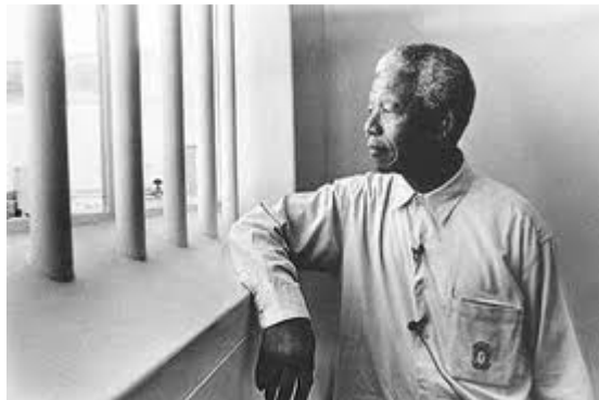
Εικόνα 6 : Νέλσον Μαντέλα, σε μία από τις θητείες του στη φυλακή.