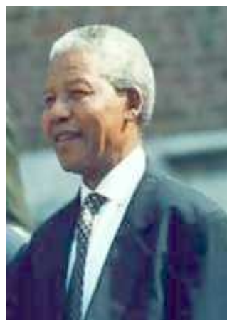
Εικόνα 2 : Νέλσον Μαντέλα