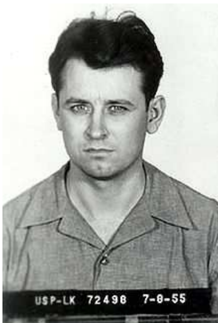
Εικόνα 4 :Τζέιμς Ιρλ Ρέι, ο άνθρωπος που κατηγορήθηκε για τη δολοφονία του Μάρτιν Λούθερ Κινγκ.

Οι δικηγόροι του Ρέι ισχυρίστηκαν ότι ο Ρέι ήταν ένας «αποδιοπομπαίος τράγος». Ένας από τους ισχυρισμούς τους ήταν ότι η ομολογία του Ρέι δόθηκε υπό πίεση, και υπό την απειλή της θανατικής ποινής. Ο Ρέι ήταν κλέφτης και διαρρήκτης, αλλά δεν είχε καμία καταγραφή για διάπραξη βίαιων εγκλημάτων ή ότι είχε κάνει χρήση όπλου. Επίσης, αν και παρουσιάστηκε ότι είχε "ρατσιστικές απόψεις", δεν ήταν ενταγμένος σε κάποια ρατσιστική ομάδα, ούτε είχε συμμετάσχει σε κάποια ρατσιστική ενέργεια.