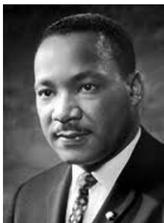
Εικόνα 1: Μάρτιν Λούθερ Κίνγκ

Σε διάφορους καιρούς , ακόμα και σήμερα , υπήρξαν άτομα τα οποία διώχθηκαν για τις ιδέες τους. Κάποιοι από αυτούς ήταν ο Μάρτιν Λούθερ Κίνγκ ( Martin Luther King ) και ο Νέλσον Μαντέλα(Nelson Mandela). Και οι δύο αγωνίστηκαν εναντίον του ρατσισμού κατηγορήθηκαν άδικα ,φυλακίστηκαν και ο πρώτος πέθανε απάνθρωπα εξαιτίας αυτού. Και οι δύο προσπάθησαν αρκετά για να πετύχουν το σκοπό τους,βραβεύτηκαν και γι' αυτό τους θεωρούμε σήμερα σημαντικά πρόσωπα.